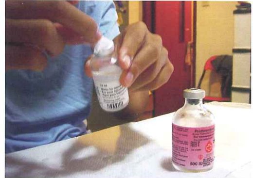
打開藥水及藥粉的樽蓋，用消毒棉抹樽頂