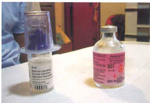
把過濾針插進藥水樽