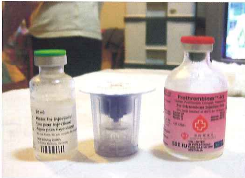
打開包裝，提出藥水、過濾針和藥粉