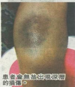
患者會無故出現深層的損傷。

發炎，影響活動能力。其他地方如肌肉、口鼻、消化系統等也有可能出血，如出現顱內出血或令患者認知能力受損，甚至死亡。」